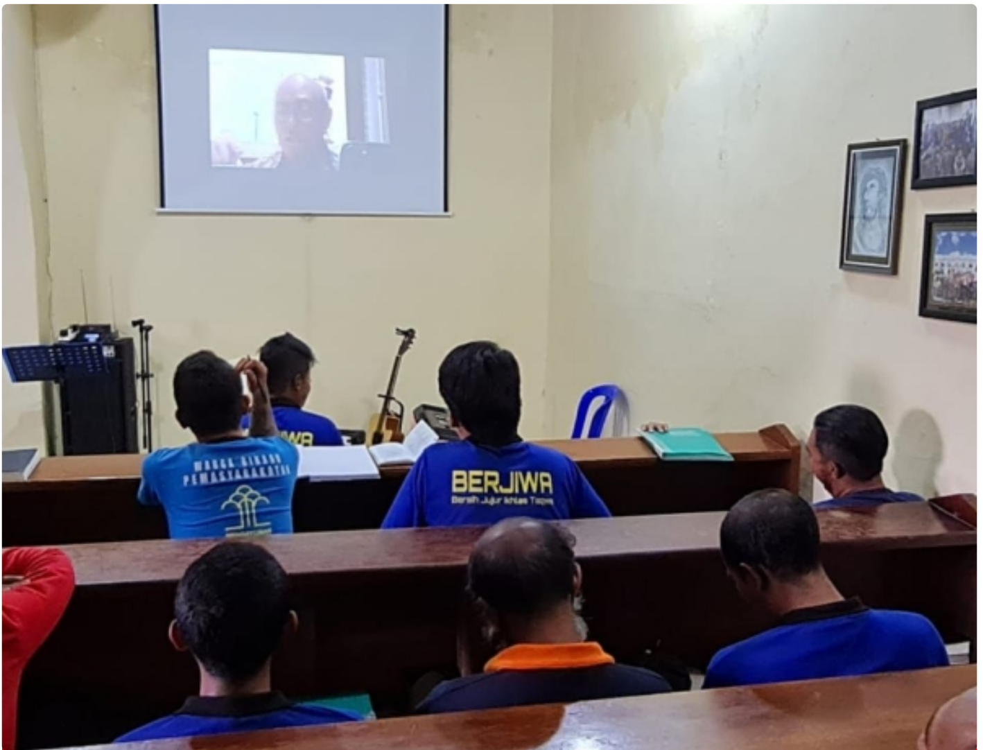
Kegiatan Ibadah WBP Umat Kristiani Lapas Ambarawa secara On Line

SEMARANG - Warga Binaan Pemasyarakatan (WBP) Lembaga